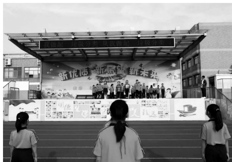
了改造,孩子们的学习生活环境得到了进一步改善,成校也在争创省一级现代化学学校进程中硬件设施得到了进一步提升。

此外,今年凤桥镇中心小学的综合楼建设项目有了实质性进展,凤桥新堂两所幼儿园建设也在顺利推进中,镇区3家幼儿园在暑假完成