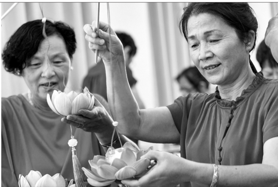
昨天,南湖区新嘉街道穆河社区组织辖区居民,举办“花灯邀明月,浓情迎中秋”古风花灯制作活动,让居民在动手实践中感受节日的温馨和传统文化的魅力。