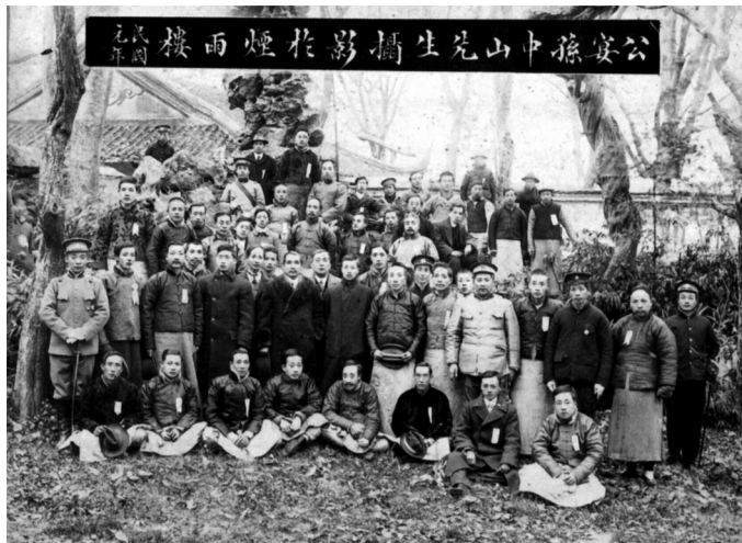
1912年，嘉兴各界欢迎孙中山先生，二排左三为褚辅成、左五为孙中山。

“革命尚未成功”，同志已长眠不醒。褚辅成回忆往昔矢志革命、推翻前清建立共和的历程，一位位故交旧友历历在目。