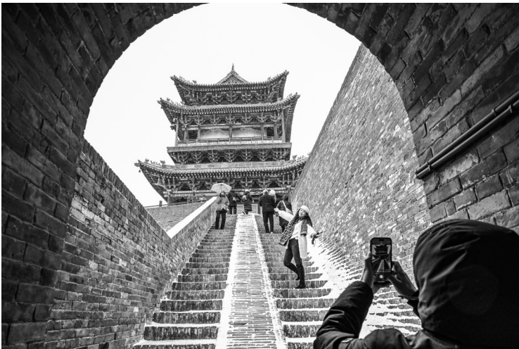
12月12日,游客冒雪在位于山西省晋中市의平遥古城游览观光。12月12日,受寒潮天气影响,多地迎来降雪。