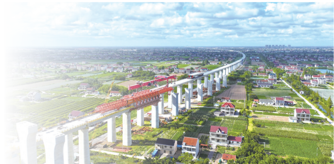
崇启高铁长江大桥。

3平方公里村域、2281个村民、2000多亩耕地,组成了一幅长江入海口独特的乡村图景。这里的故事还在继续书写——在与自然和谐共生的画卷上,每一笔都是对“绿水青山就是金山银山”的生动诠释,每一画都在描绘着乡村振兴的幸福底色。