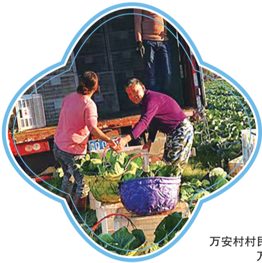
万安村村民采收蔬菜。