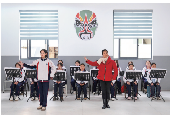
缙云县盘溪中学的婺剧课。