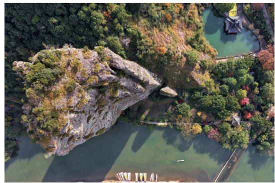
缙云仙都景区的鼎湖峰堪称“天下第一峰”“天下第一笋”。