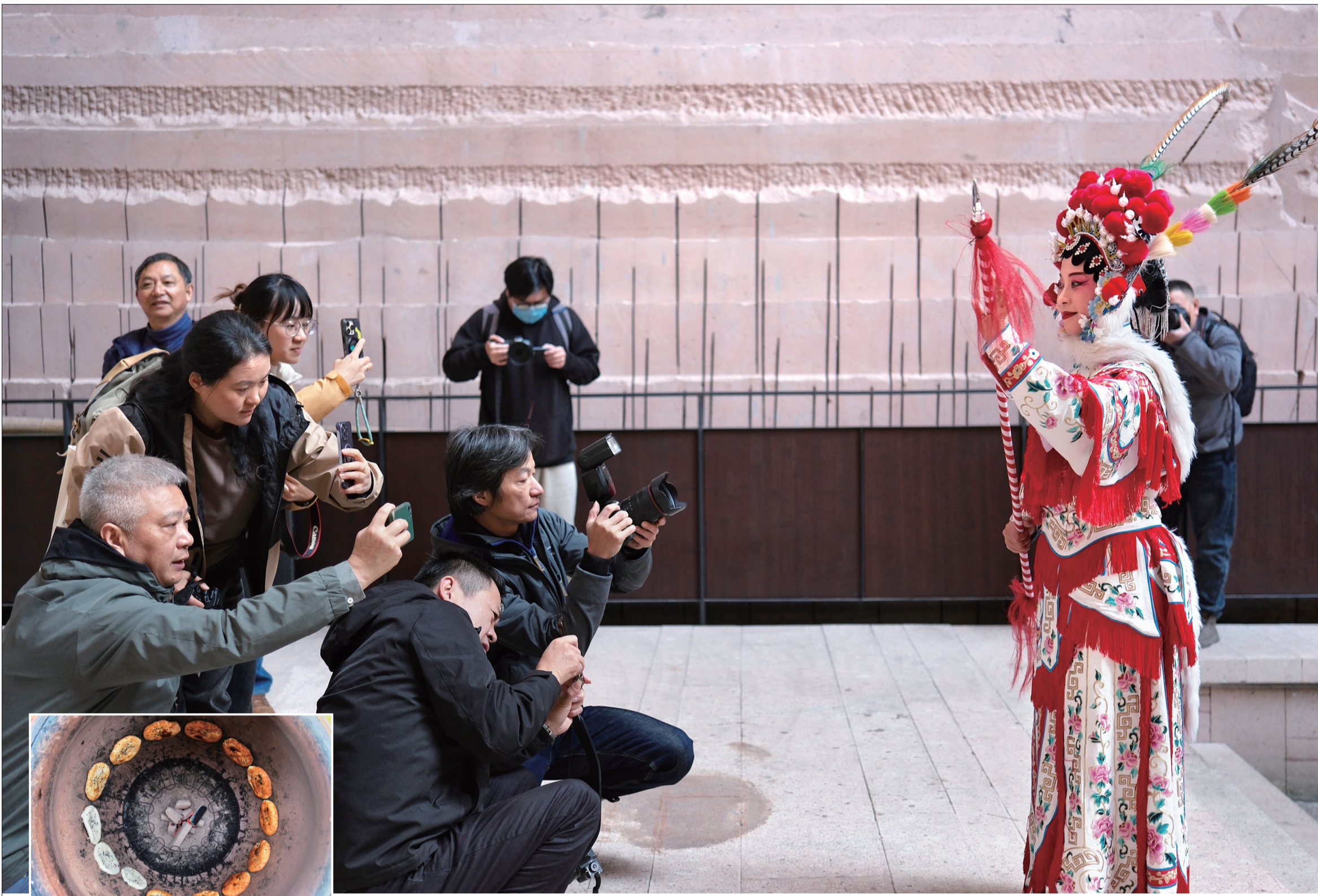
烤炉中的缙云烧饼独具风味。