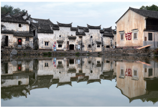
河阳古民居,现存以元代“一溪二坑”“四纵五横”棋盘式布局为核心的明清古建筑群。