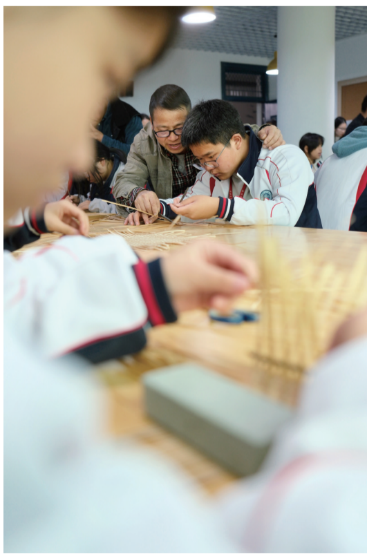
缙云县盘溪中学的竹编课。