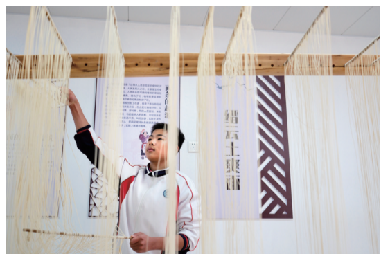
缙云县盘溪中学的学生制作当地的土面。