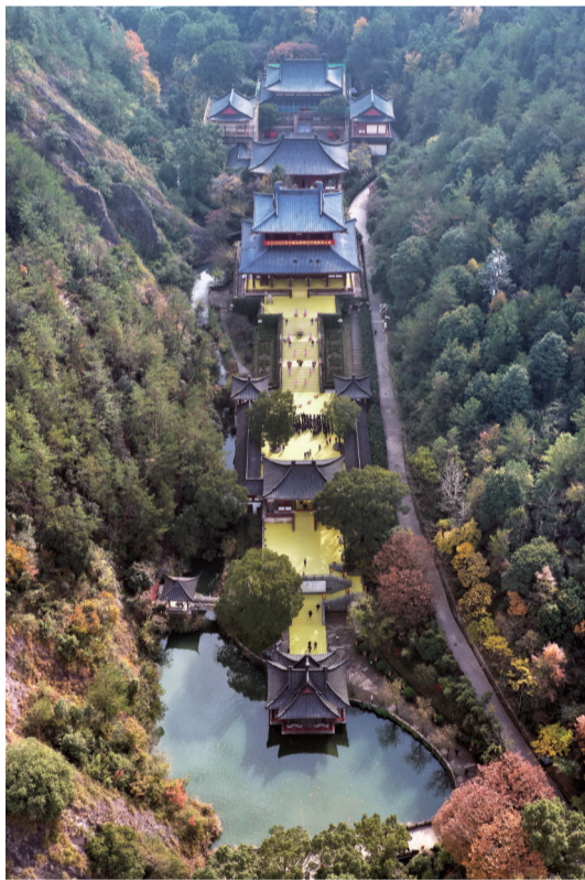
缙云黄帝祠宇的祭祀活动延续千年。

在一天多的行程里,摄影记者们用镜头,既定格了缙云的绿水青山,也记录了城乡融合的发展脉动;既捕捉了传统文化的现代表达,也展现了产业兴旺的富民实践。