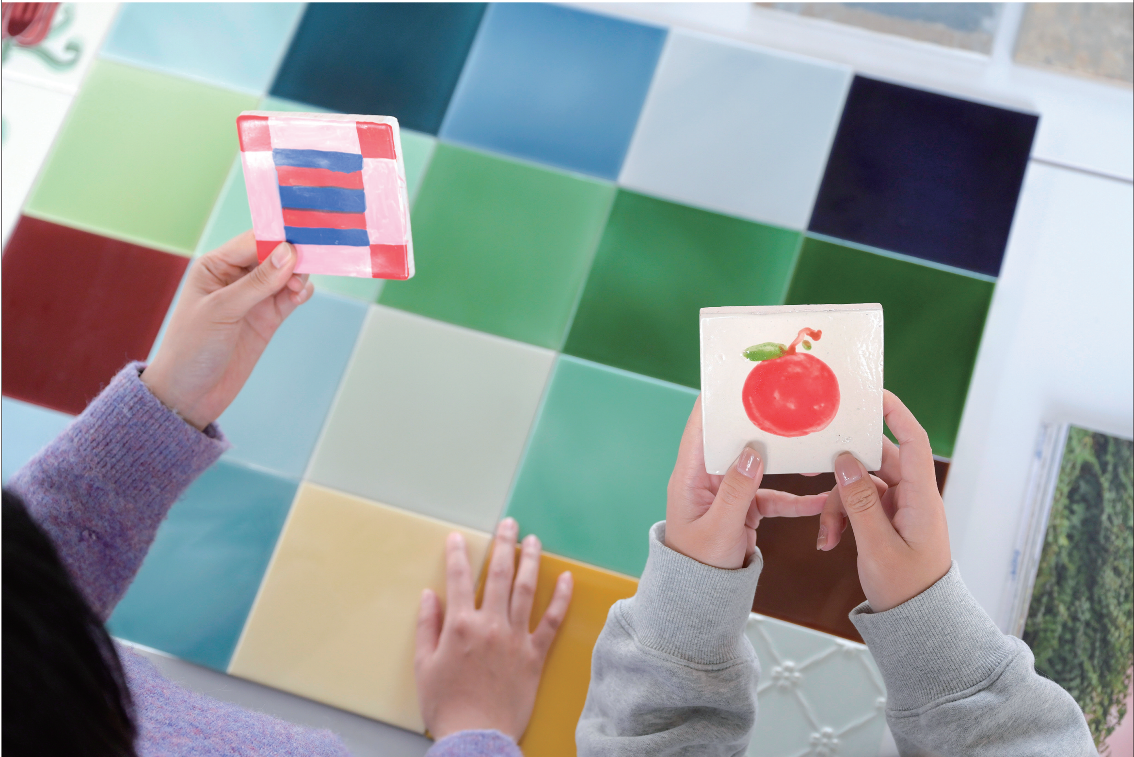
相比于传统的大砖,如今这种花样繁多、颜色丰富的个性小砖更受年轻人追捧。