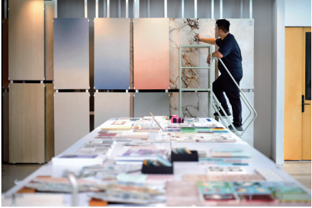
工作室内的瓷砖品类众多,每平方米的价格在百元到千元不等。