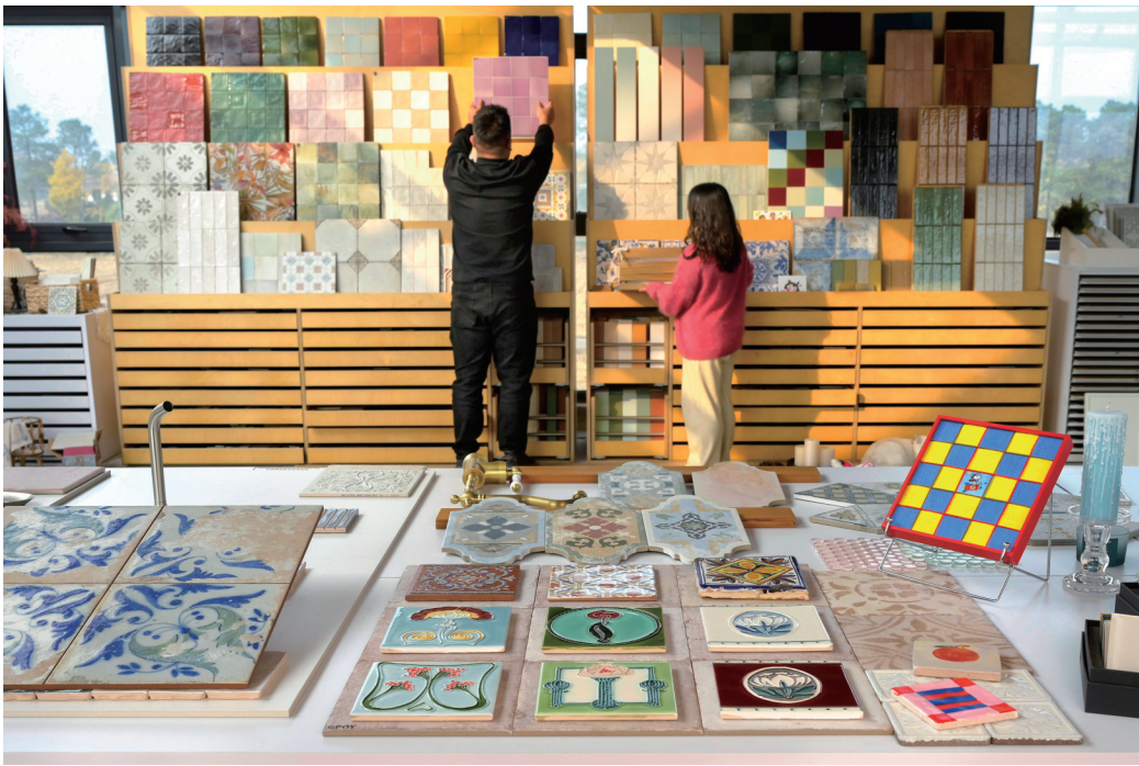
阳光透过窗户洒入工作室,窗外是连绵田野,室内陈列着色彩斑斓、图案别致的瓷砖。

冬日的阳光缓缓移动,洒在色彩斑斓的瓷砖上,折射出温暖光晕。这座藏在乡野的瓷砖工坊,不仅承载着一对夫妻的创业梦想,更见证着余新镇与青年人才的双向奔赴,让小众瓷砖在乡野间绽放大能量,为和美乡村注入持久的文艺活力。