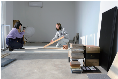
工作室运营的小红书账号已成为吸引客户的重要窗口。近四成客户从线上引流而来,甚至不乏从外地专程赶来的年轻人。