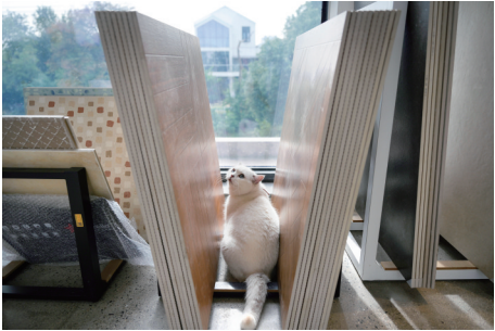
工作室里的“毛孩子”喜欢在瓷砖间玩耍,给这片空间更添一份活力。