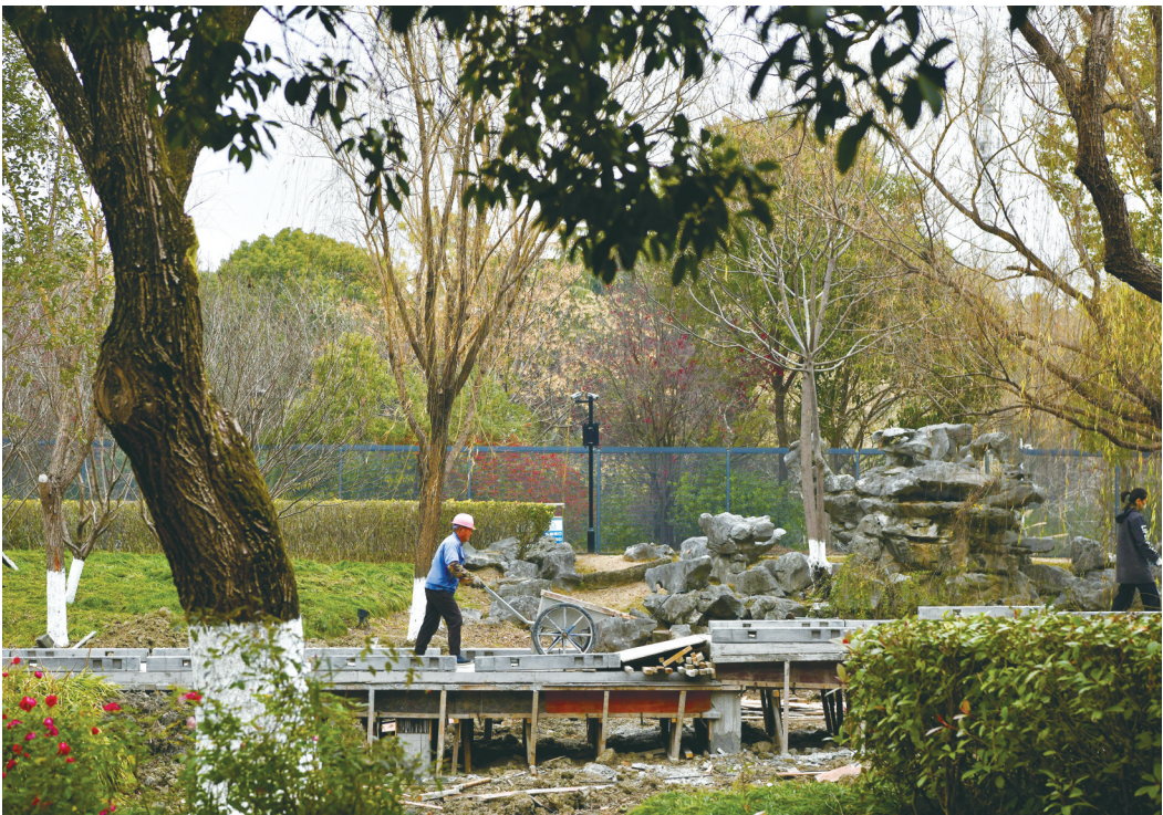
昨天，秀洲区春晓公园内的景观栈桥正在施工。由于建造时间久以及临水等原因，原来的木质栈桥已有多处破损，存在安全隐患，现在将其替换为石材长桥，保障市民行走安全。