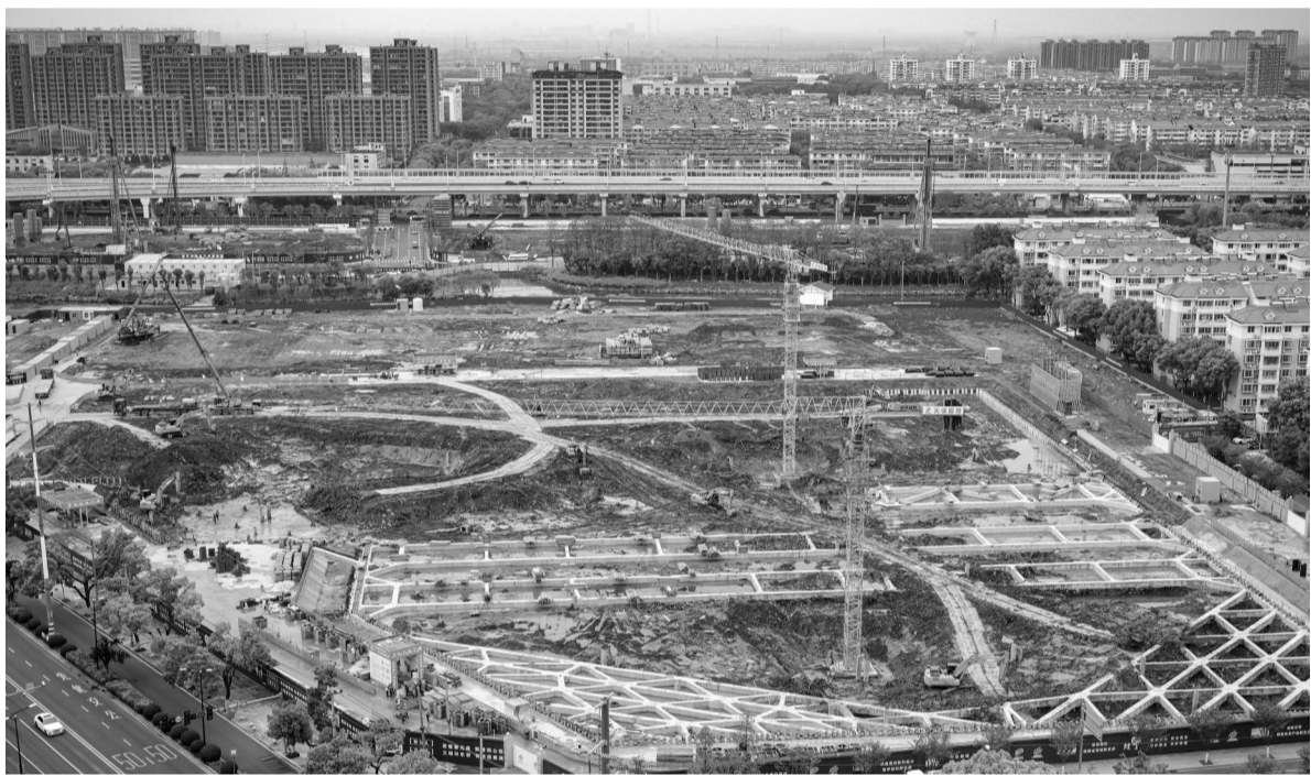
昨天,位于南湖区新嘉街道的嘉禾智谷产业园项目建设现场一派火热,工人们正在各自的岗位上忙碌着。作为城北产业新引擎,该项目预计2027年底全面竣工,未来将成为“生产、生活、生态”三生融合的工业社区,为嘉兴主城区产业升级注入强劲动能。