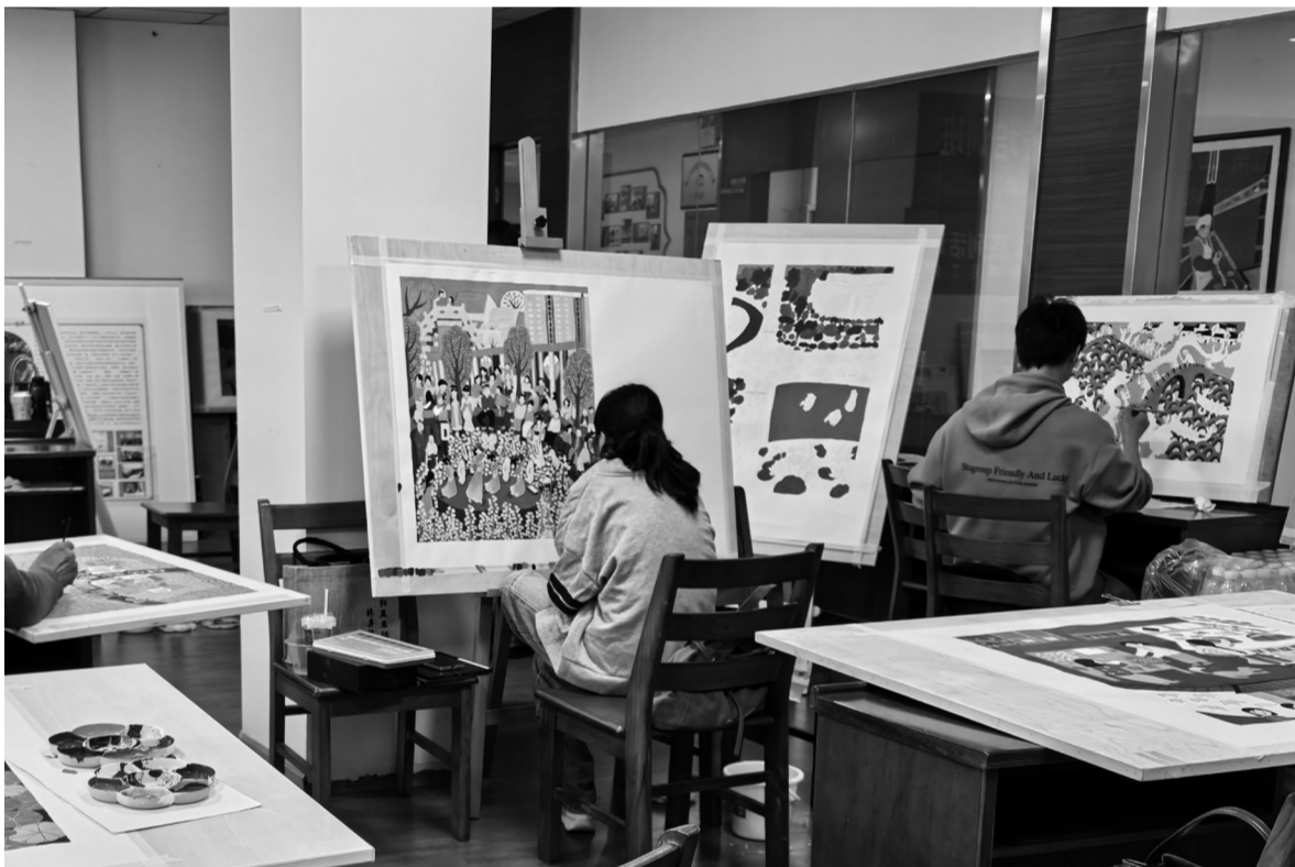
前天,秀洲区“一村一画·醉江南”2026年王江泾镇农民画创作公益培训结业。培训期间,学员们深入乡村,体验生活,创作的作品生动展现了当地生机勃勃的农村新风貌。

秀洲区市场监管局提醒广大消费者:购买散装即食食品,请尽量选择证照齐全、环境整洁、信誉良好的商家。食用前注意观察色、味是否异常,并保留好购物凭证。如出现不适,应及时就医并保留病历、化验单等相关证据,拨打12315电话维权。同时,我们也呼吁广大经营者,诚信为本,严把食品质量关,共同维护和谐、安全、放心的消费环境。