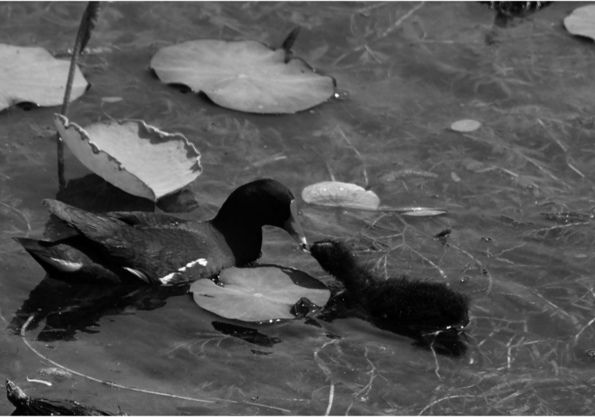
近日，市区范蠡湖公园黑水鸡家族又添新成员。池塘中，黑水鸡妈妈领着幼鸟四处觅食。