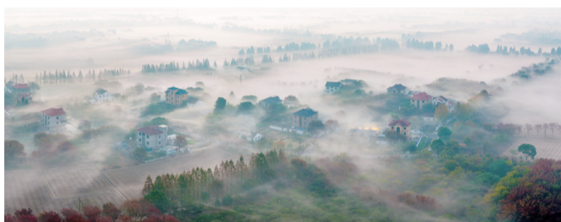
《疑是瑶台落凤桥》组照之一（二等奖作品）