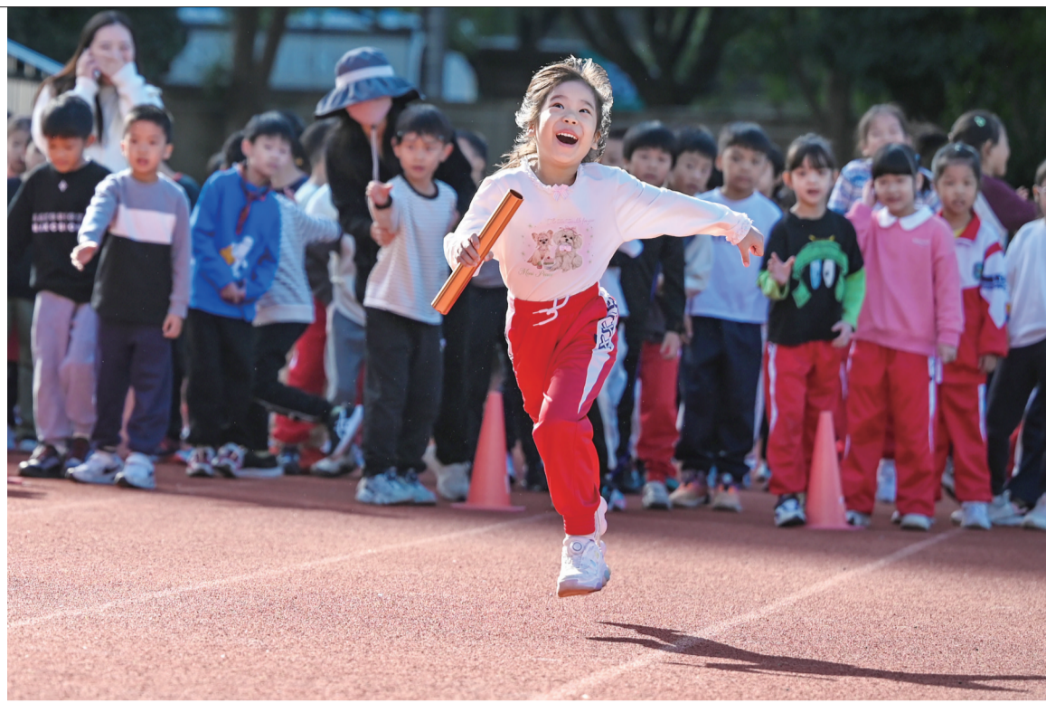
《学在南湖》组照之一（一等奖作品）