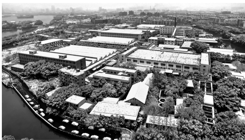
《从毛纺总厂到红船干部学院的变迁》组照之二（上下）（三等奖作品）