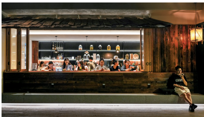
《小店“烟火气”，越夜越时尚》组照之一（二等奖作品）