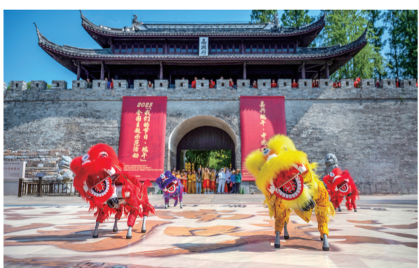
《机甲狮跃垣，科技接民俗》（三等奖作品）