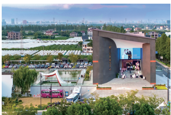
《初心101驶进三星的春天》（三等奖作品）