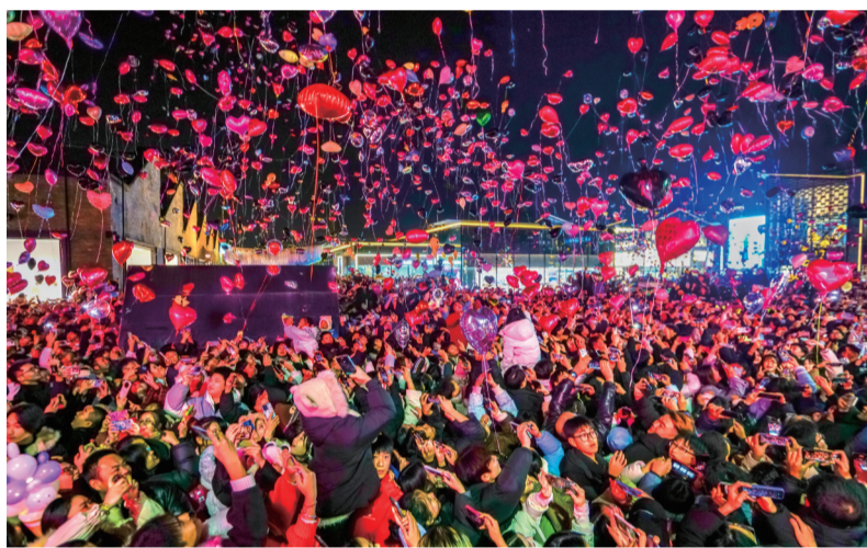
《放飞心愿》（二等奖作品）