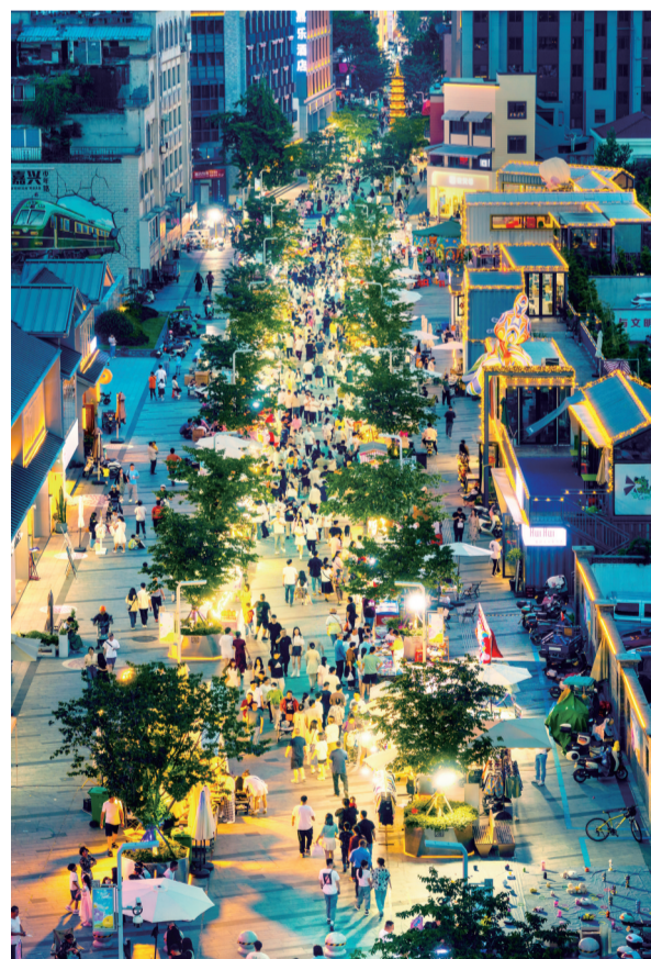
《乐游嘉兴》组照之一（三等奖作品）