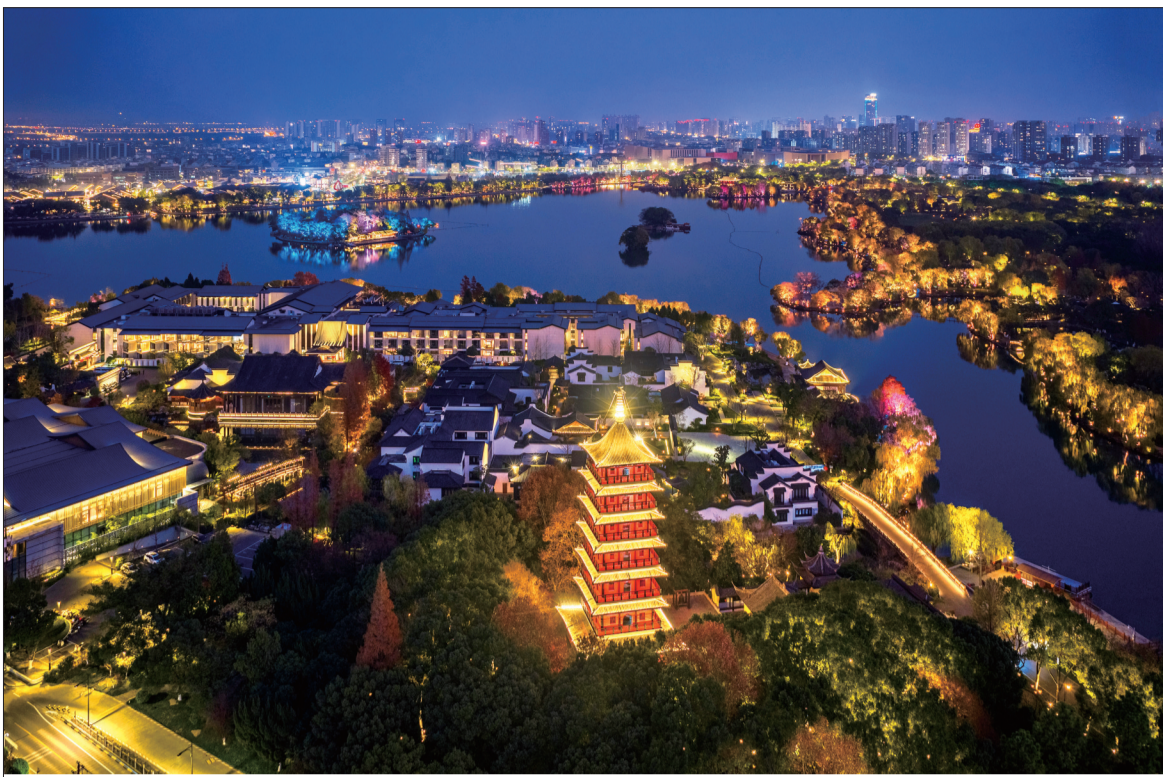
《璀璨南湖夜色》组照之一（一等奖作品）