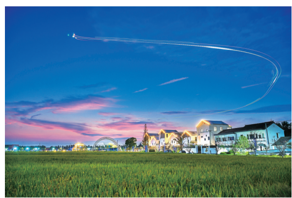
《南湖低空经济》组照之一（三等奖作品）