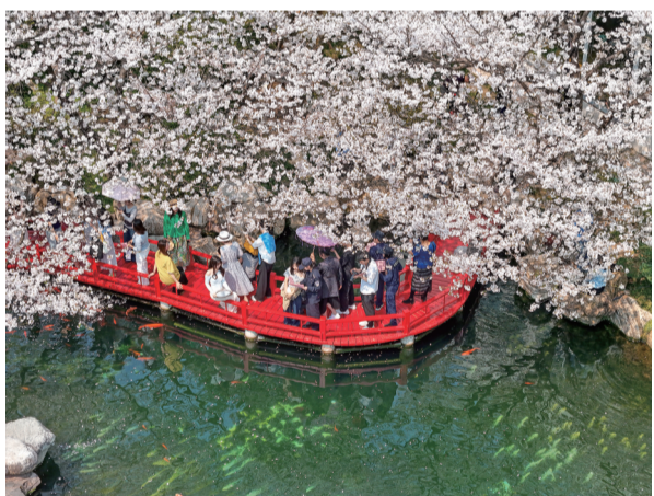
《樱花开“警”相随》（三等奖作品）