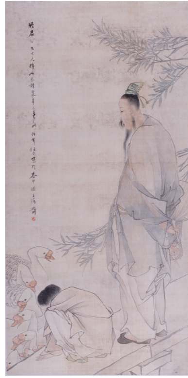
清代 任伯年 羲之爱鹅图轴