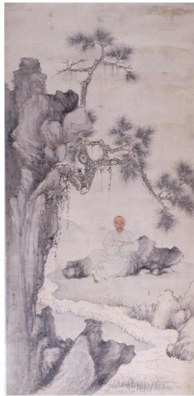
清代 华岳 人物肖像图轴