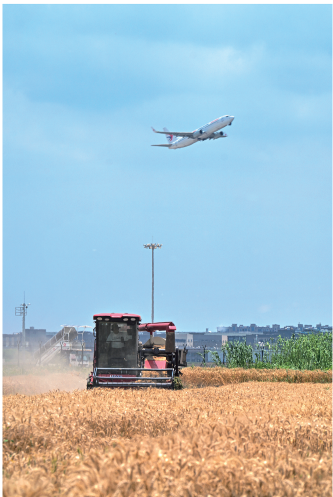
从嘉兴飞往西安的航班起飞,飞机掠过秀洲区洪合镇正在收割的麦田。