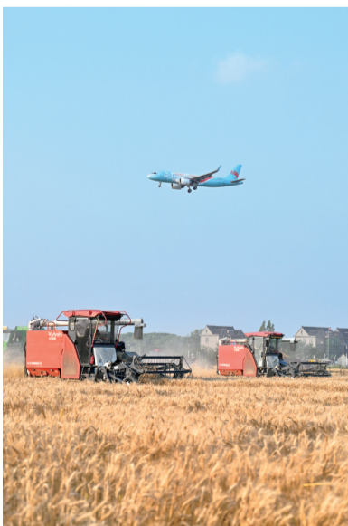
秀洲区洪合镇,农场的麦田集中收割,即将在嘉兴南湖机场降落的航班掠过“丰”景。