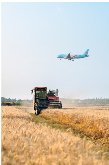
从深圳飞往嘉兴的航班在降落前掠过秀洲区洪合镇正在收割的麦田。