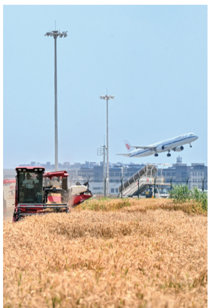
从嘉兴飞往北京的航班腾空而起。