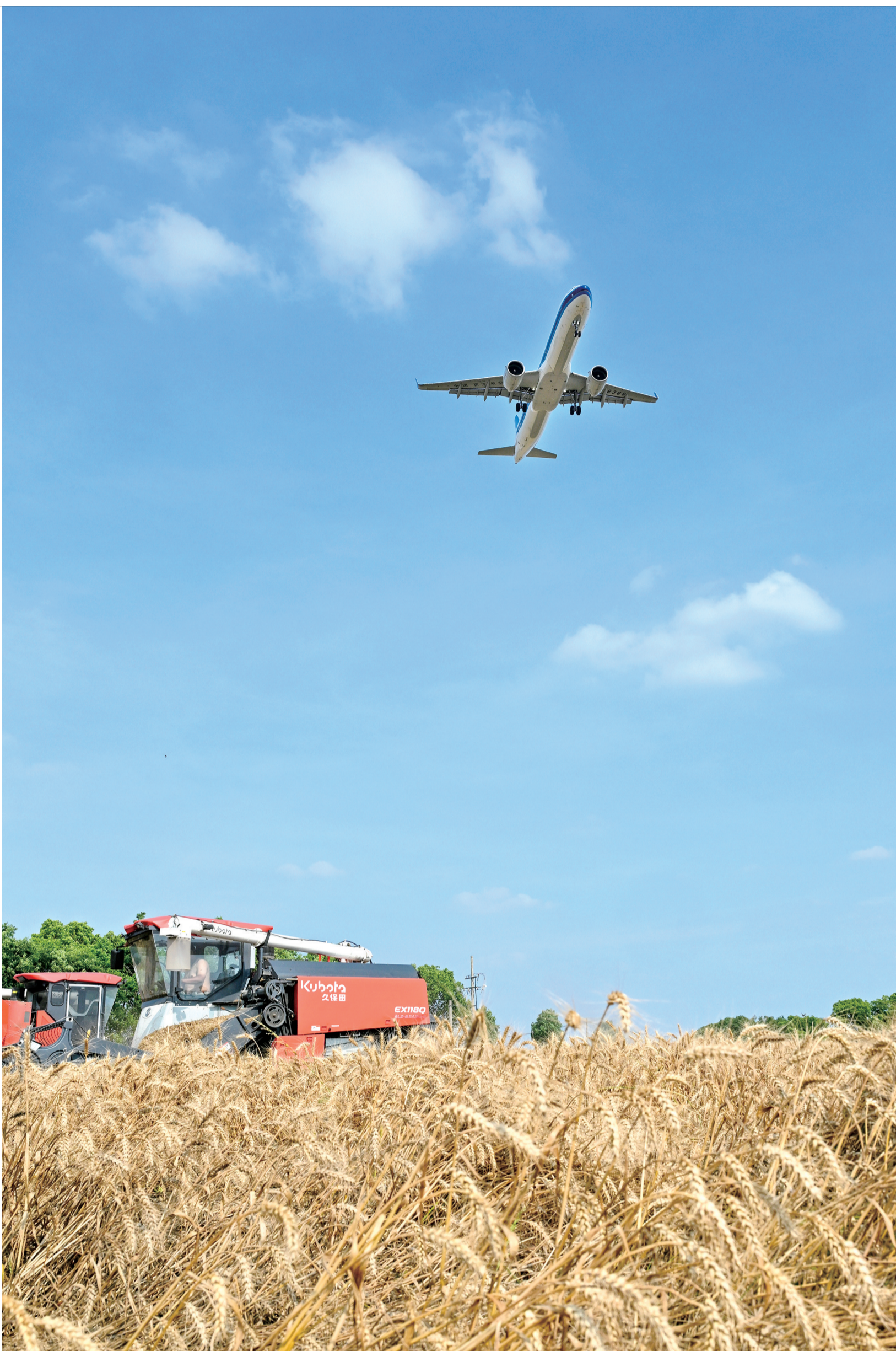
从广州飞往嘉兴的航班掠过秀洲区洪合镇正在收割的麦田。