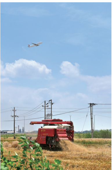
从嘉兴飞往深圳的航班掠过秀洲区洪合镇正在收割的麦田。