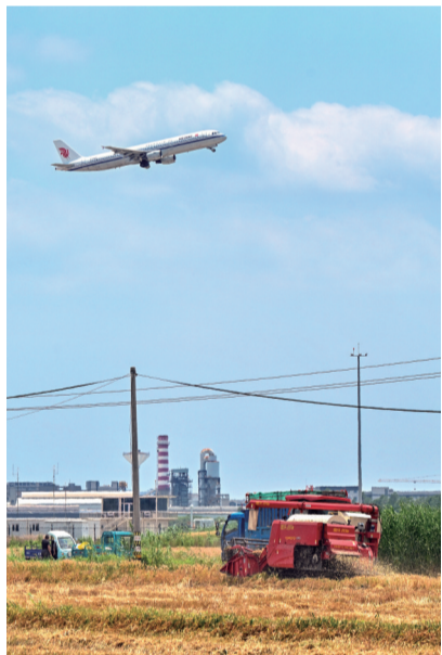
秀洲区洪合镇,毗邻机场的1036亩高标准农田上空飞机掠过,农田里收割机轰鸣,一片繁忙景象。