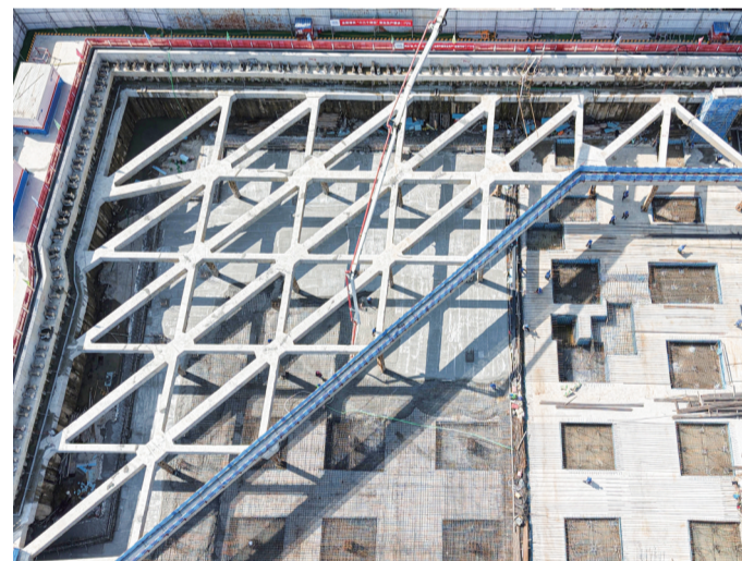
作品名称:《城市地下脉络》 简介:俯瞰运河湾项目工地,深基坑支撑结构如脉络舒展,见证城市建设的坚实根基。