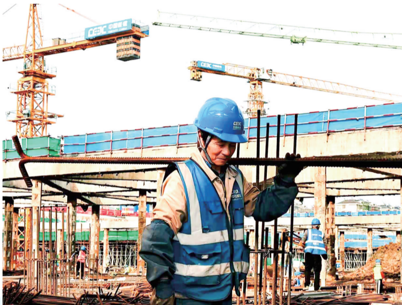
作品名称:《钢筋上的脊梁》 简介:晨光下,工人肩扛钢筋步履不停,以双手搭建城市的骨架,用汗水浇筑未来的轮廓。