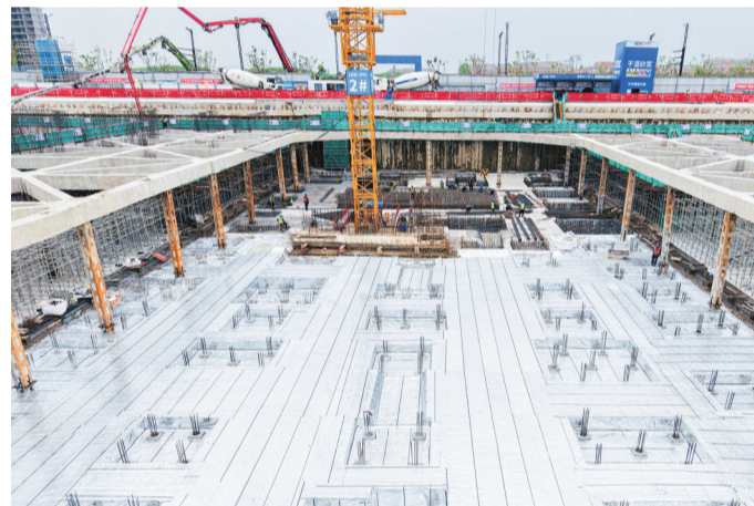
作品名称:《二标段四区块防水卷材铺贴》 简介:基坑在垫层施工完成后,已按设计及规范要求铺设高分子膜自粘沥青防水卷材,卷材搭接缝、桩头防水节点处理规范,防水施工质量可控。