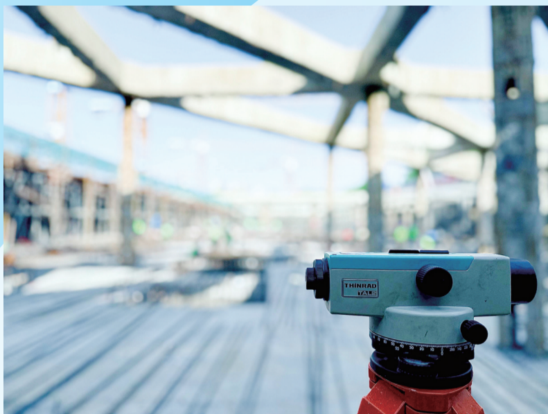
作品名称:《不会说谎》 简介:采用浅景深拍摄,突出前景水准仪,虚化工地背景,体现工程测量的严谨氛围。