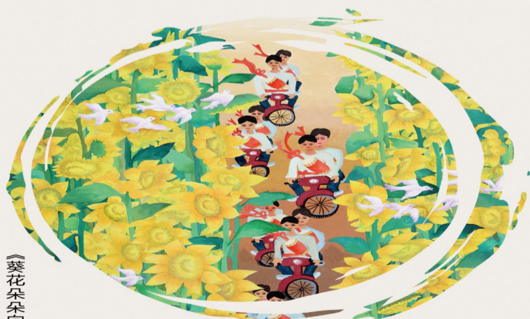
《葵花朵朵向太阳》孟娣玲作