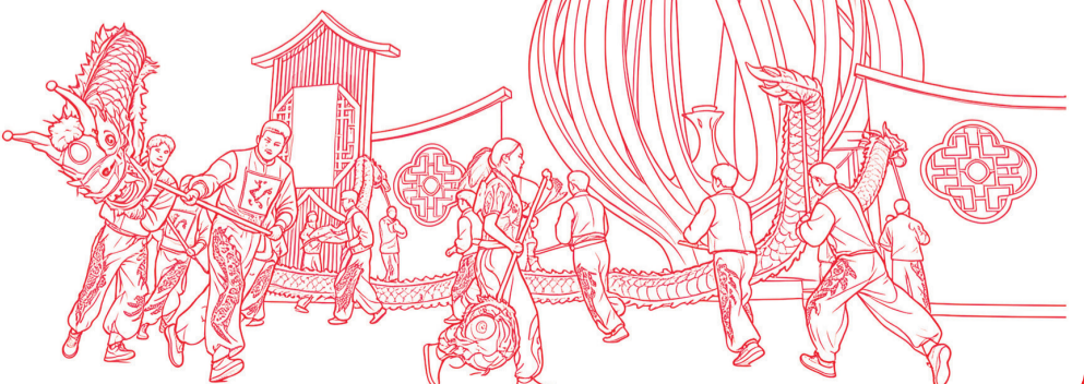
插画由手绘+AI辅助生成

Where the Red Boat Sets Sail The Finest of Jiangnan Prevails