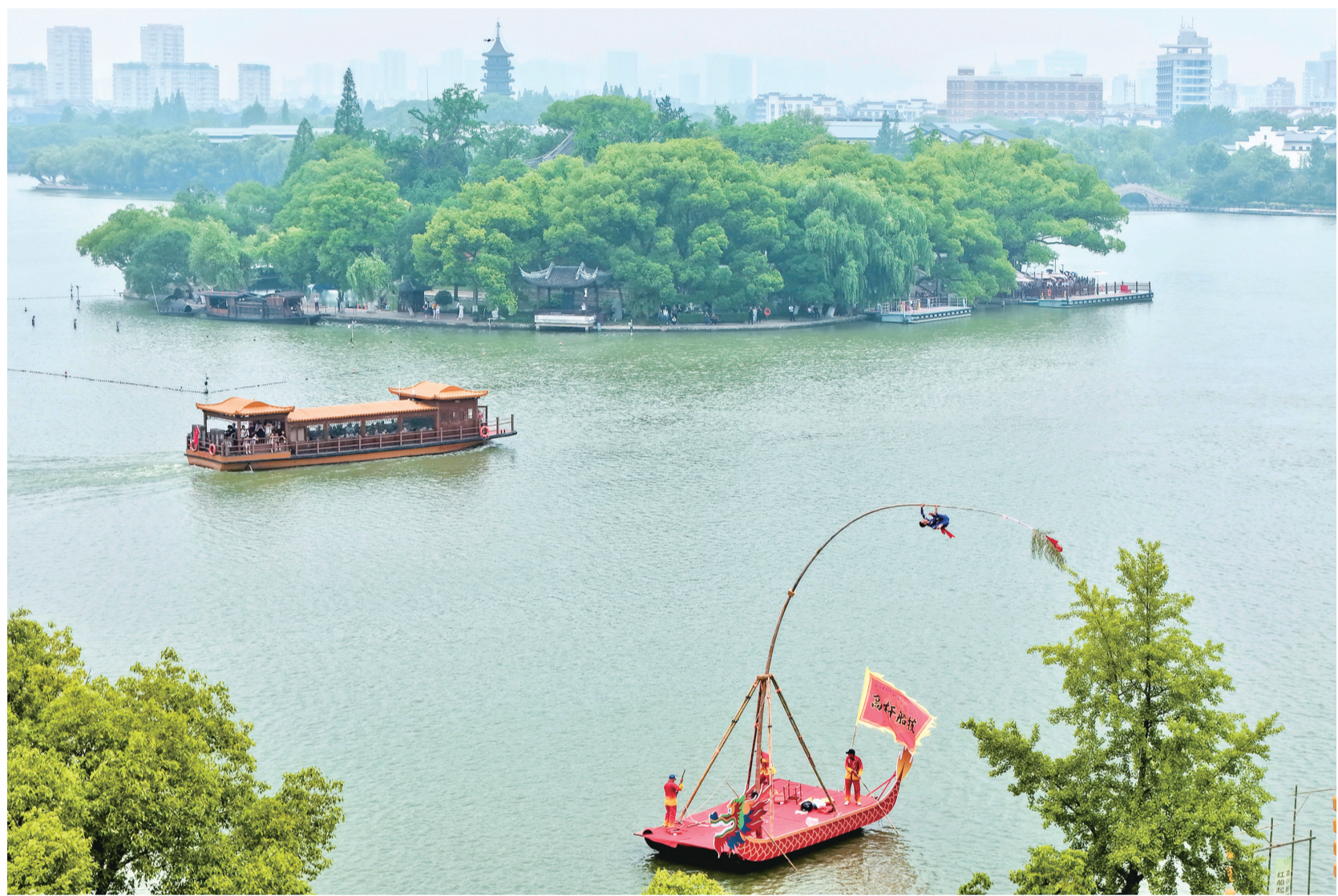
昨天,在南湖水面上,来自桐乡洲泉镇的国家级非遗项目高杆船技亮相嘉兴端午民俗文化活动。

文化是一座城市发展的根脉与灵魂。嘉兴将以此次系列活动为契机,着力展示好嘉兴端午、浙江风采、中国味道,进一步保护好、传承好、弘扬好中华优秀传统文化,更好担负起新时代的文化使命,加快建设高水平文化强市,为奋力谱写中国式现代化嘉兴新篇章注入强大精神力量。