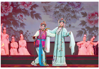
昨晚,“浙里有戏·嘉兴好腔调”端午戏曲专场在嘉兴536艺术空间举行。