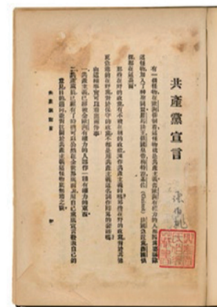
南湖革命纪念馆“镇馆之宝”，1920年9月出版的陈望道译《共产党宣言》。