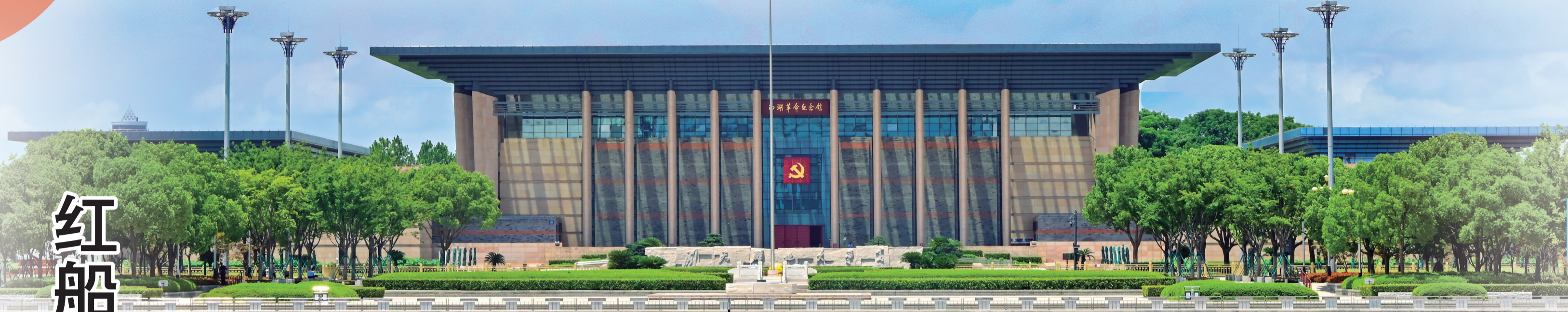
南湖革命纪念馆新馆占地面积2.73公顷，由“一主两副”三幢建筑组成，总面积19247平方米。整个建筑造型呈“工”字形，代表中国共产党是工人阶级的政党。建筑四周有56根立柱，寓意中华大家庭56个民族紧密团结在党的周围。