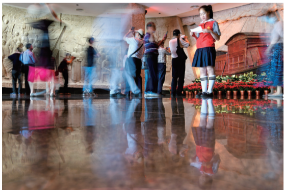
2021年6月8日,在嘉兴南湖革命纪念馆,“红船小讲解”在讲解点熟悉讲解稿。