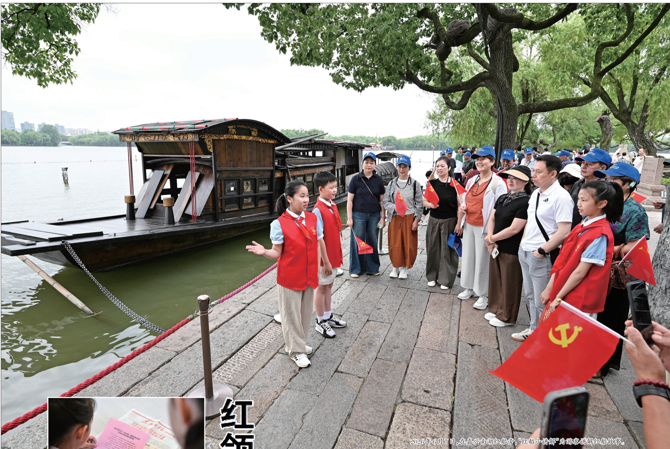
2026年6月7日,在嘉兴南湖红船旁,“红船小讲解”为游客讲解红船故事。