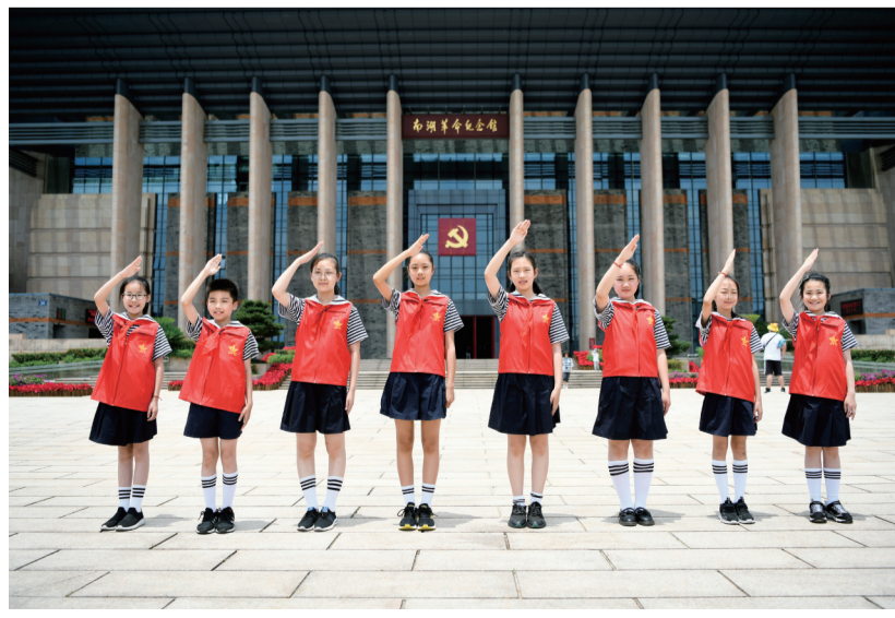
2021年6月8日,“红船小讲解”在嘉兴南湖革命纪念馆广场上合影。