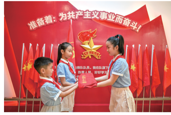
2026年6月24日,在嘉兴实验小学,即将小学毕业的“红船小讲解”将讲解马甲传递给学弟学妹。