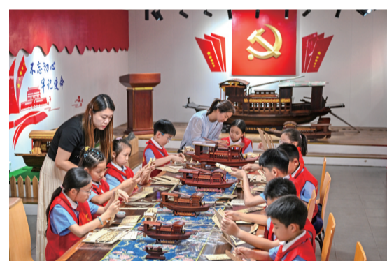
2026年6月26日,在嘉兴市南湖区余新镇,“红船小讲解”了解红船模型榫卯结构制作工艺,在拼装船模的过程中接受红色教育。

以南湖革命纪念馆为起点,浙江嘉兴和上海的少先队红领巾讲解员携手共进,互相学习,接力讲解——从上海石库门到嘉兴红船,处处都有他们的身影。他们在讲解中锻炼成长,逐渐成为红色基因的小小传播者。他们把红色信仰,传递给一批批从全国各地来到中共一大纪念馆和南湖革命纪念馆的游客,让红色基因一代代赓续下去,用实际行动践行着“听党话、跟党走”的铮铮誓言。