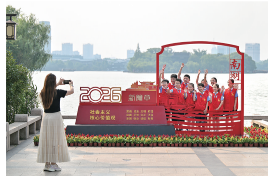
2026年6月26日,在嘉兴南湖会景园,“红船小讲解”以湖心岛为背景留下合影。