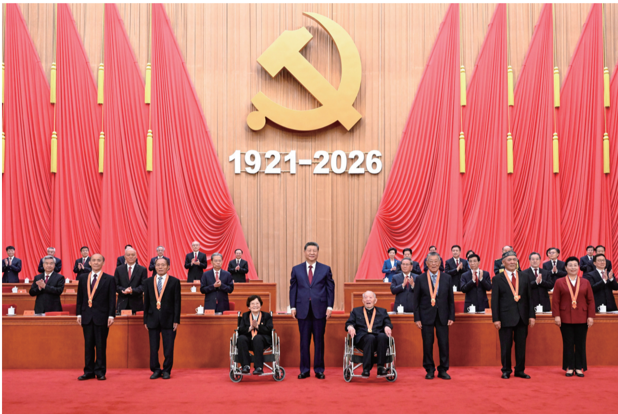
7月1日上午,庆祝中国共产党成立105周年大会在北京人民大会堂隆重举行。中共中央总书记、国家主席、中央军委主席习近平向“七一勋章”获得者颁授勋章。

新华社北京7月1日电 庆祝中国共产党成立105周年大会7月1日上午在北京人民大会堂隆重举行。中共中央总书记、国家主席、中央军委主席习近平向“七一勋章”获得者颁授勋章并发表重要讲话。他强调,105年来,我们党始终坚守为中国人民谋幸福、为中华民族谋复兴的初心使命,在不懈奋斗中创造了彪炳史册的伟大成就。新征程上,全党同志要坚定信心、接续奋斗,不断创造无愧于时代和人民的新业绩。