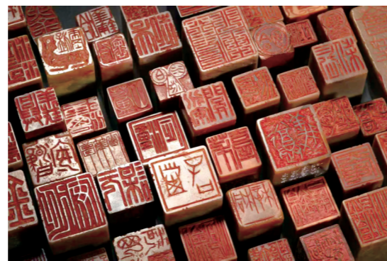
钱君匋刻《长征印谱》