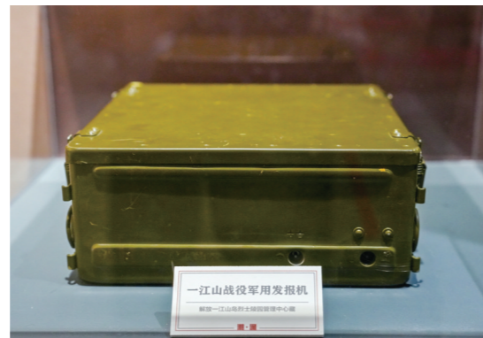
一江山战役军用发报机