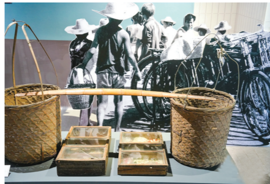
20世纪80年代竹筐式货郎担