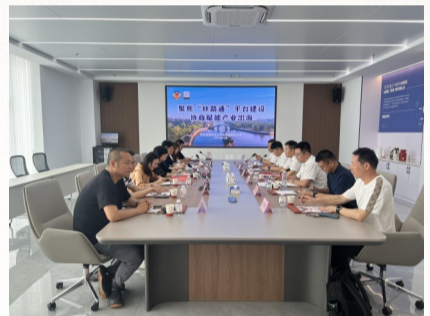
跨界协商精准破题

活动期间,各界别委员下沉一线察民情、听民声、解民忧,把协商议事台搭在企业一线、校园课堂、社区乡村,持续走好“让政协走进群众、让群众走进政协”的履职路径,汇聚各界别多元力量,为秀洲高质量发展注入政协履职动能。