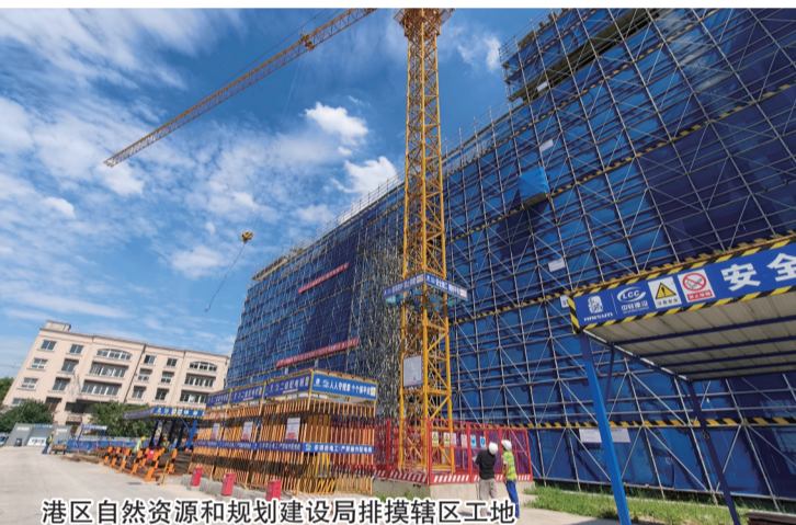
港区自然资源和规划建设局排摸辖区工地