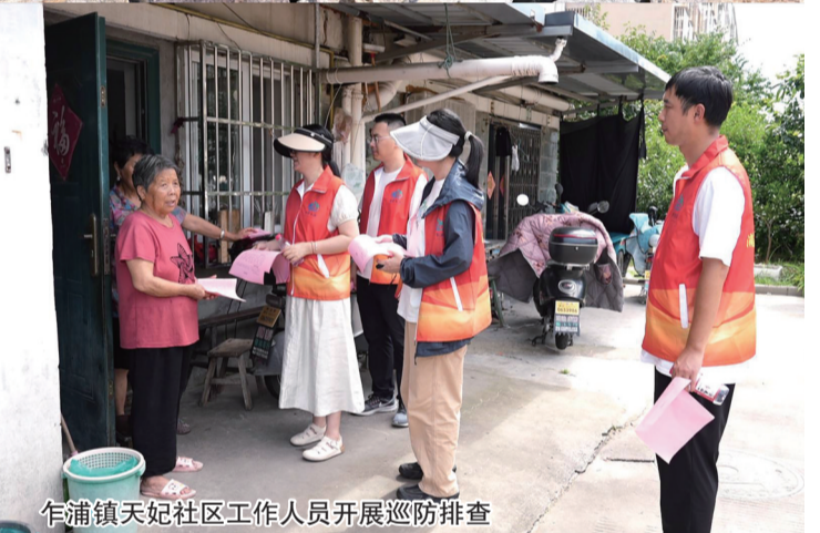
乍浦镇天妃社区工作人员开展巡防排查