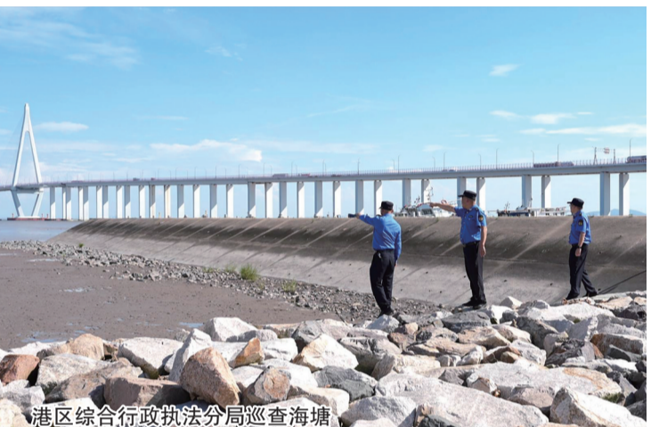
港区综合行政执法分局巡查海塘