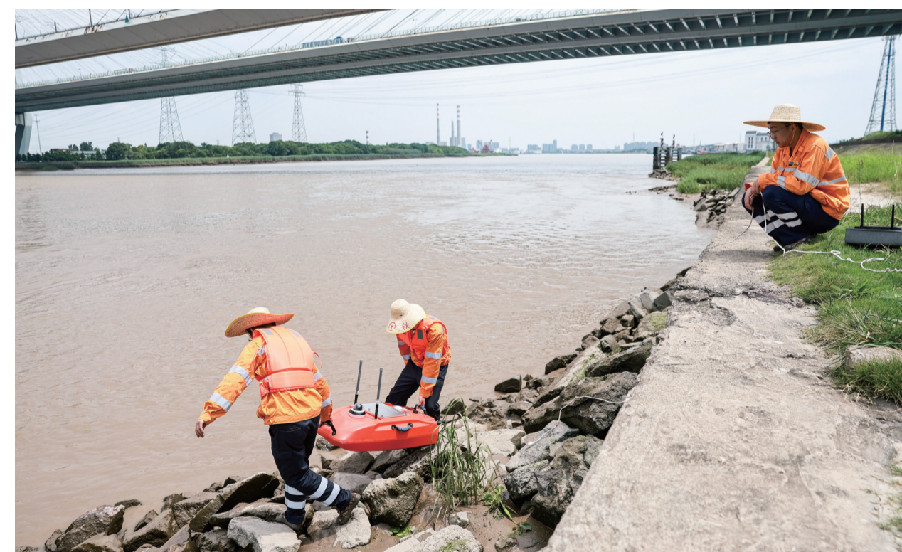
7月9日,铁路宁波工务段职工在甬江特大桥下准备使用无人船进行智能巡检工作。

新华社北京7月9日电(记者 黄轶铭)记者从应急管理部获悉,国家防总9日将针对浙江福建的防汛防台风四级应急响应提升为三级。台风“巴威”登陆强度大、影响范围广、致灾性强,防范应对