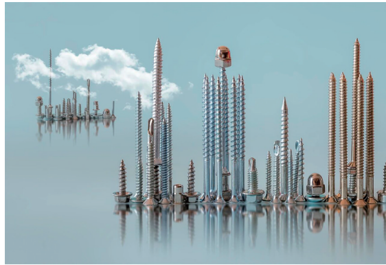
《智造“城市”》(商业与创意类 组照) 莫益华