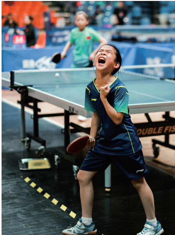
《胜利的呐喊》(纪录类 单幅) 顾然