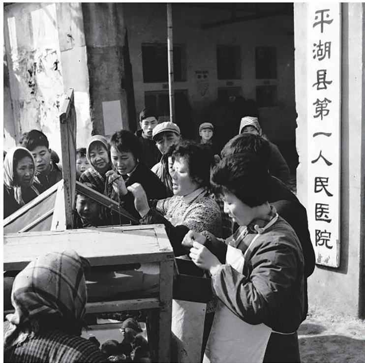
《家乡百姓生活变化——最好见证》(纪录类 组照) 张强国

同时，嘉兴摄影嘉年华期间，另一项重要内容“融”——2025嘉兴摄影嘉年华·现场摄影比赛也公布了评选结果，并举行了颁奖典礼。