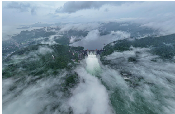
《吞云吐雾》(艺术类 单幅) 黄利民