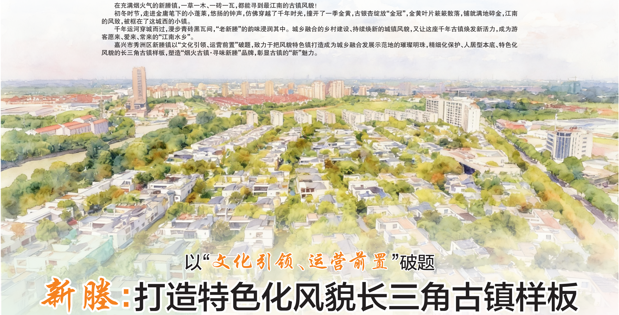
■撰文 陈 曦 王凌霄