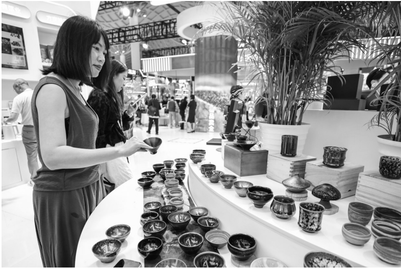
2025年4月15日，观众在第五届中国国际消费品博览会上参观建盏产品。

持经济稳定运行的同时，各方面坚定不移推动经济转型和高质量发展。创新、协调、绿色、开放、共享发展都取得新的成绩。