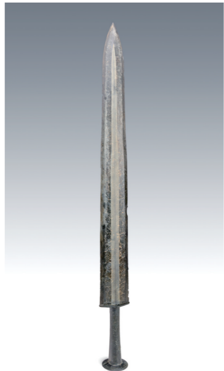
战国青铜剑 嘉善博物馆藏

不妨走进马家浜文化博物馆,在文物与历史的对话中,感受江南的另一种表情——那是一种在烽烟中淬炼、在耕耘中生长的深沉力量,穿越千年,依然生生不息。