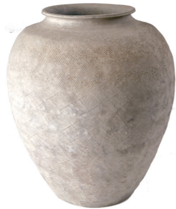
战国印纹陶罐 嘉兴博物馆藏