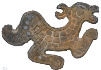
东周青铜饰件 浙江省文物考古研究所藏