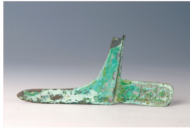
战国青铜戈 嘉兴博物馆藏