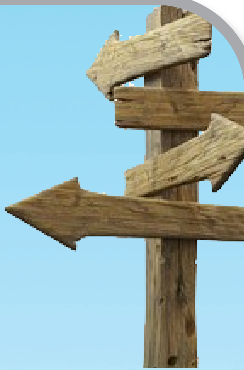
■记者 冯思家 通讯员 徐嘉君 邵建平